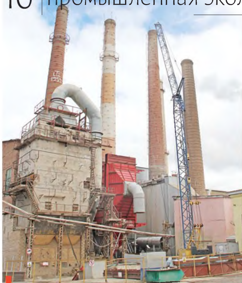
Замена электрофильтров на обжиговых печах