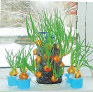
Номинация «Весна на подоконнике» Галина Рудакова