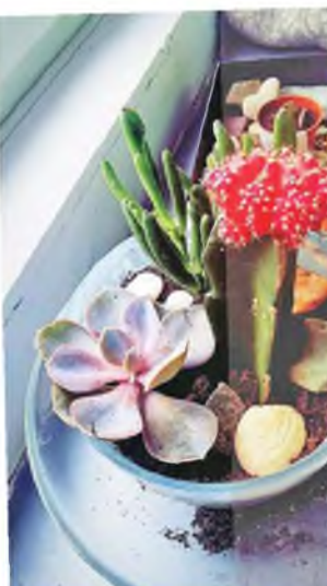
Номинация «Весна на подоконнике» Юлия Морозова