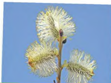
Номинация «Пробуждение природы» Андрей Горшков