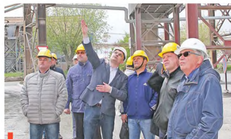
Депутаты на экскурсии по Староцементному заводу

Сухоложские депутаты познакомились с экологической политикой Староцементного завода