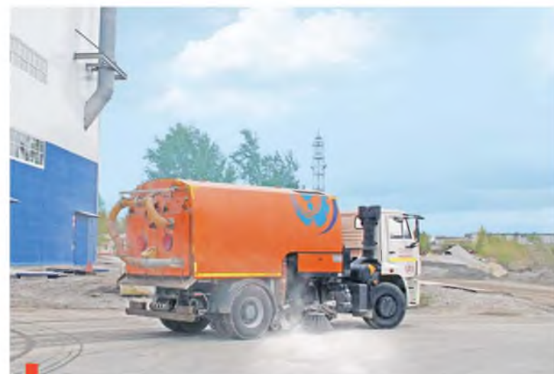
По территории предприятия курсируют автопылесосы

Чтобы лучше взаимодействовать с жителями и организациями, на предприятии создан отдел по связям с общественностью. Мы стали еще более открытыми.